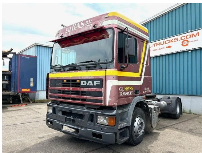
DAF 95.360 ATI SPACECAB (DUTCH TRUCK) (EURO 2... 4x2