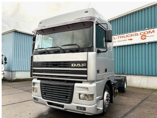
DAF 95.430 XF SPACECAB (EURO 2 / ZF16 MANUAL ... 4x2