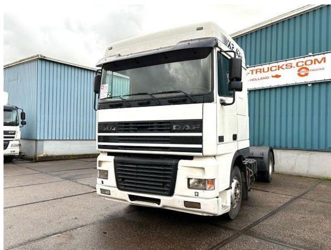
DAF 95.430 XF SPACECAB (EURO 3 / ZF16 MANUAL ... 4x2