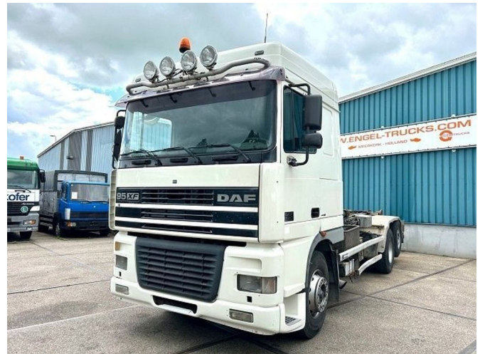
DAF 95.480 XF SPACECAB 6x2 WITH HOOK-ARM SYSTEM...