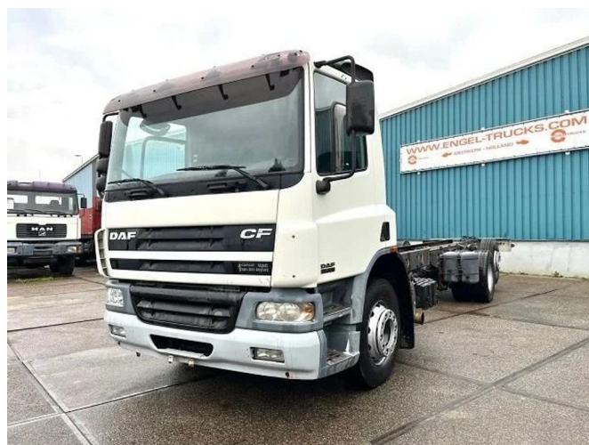
DAF CF 75.250 6x2 DAYCAB CHASSIS (EURO 3 / ZF MAN...