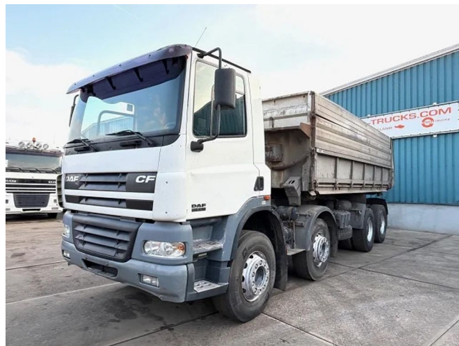
DAF CF 85.430 8x4 FULL STEEL 20m3 KIPPER (EURO 3 / ...