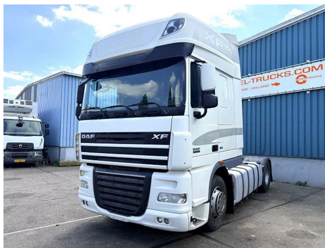
DAF XF 105.460 ATE SUPERSPACECAB (EURO 5 / Z... 4x2 Referenznummer: SN 60383030