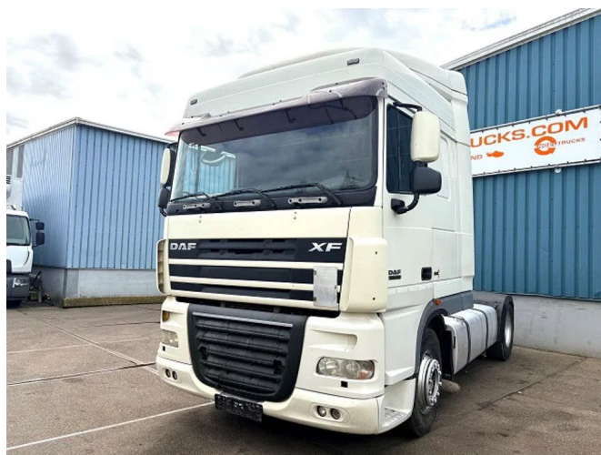
DAF XF 105.460 SPACECAB (EURO 5 / ZF16 MANUAL... 4x2