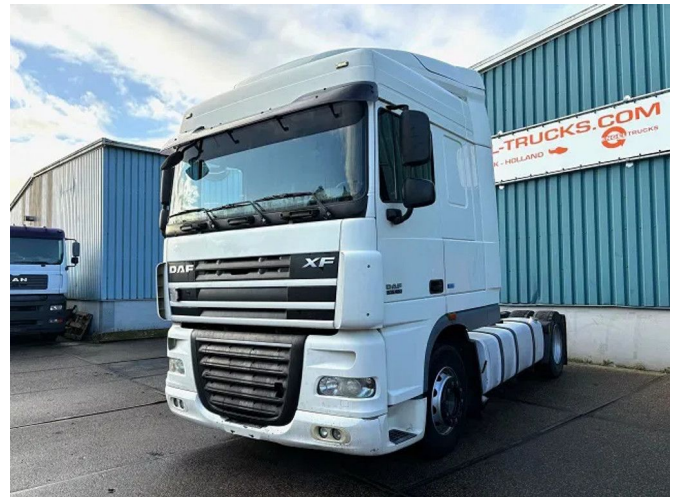
DAF XF 105.460 SPACECAB (ZF MANUAL GEARBOX / ... 4x2 Referenznummer: SN 57332409