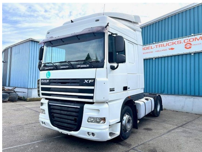
DAF XF 105.460 SPACECAB (ZF16 MANUAL GEARB... 4x2