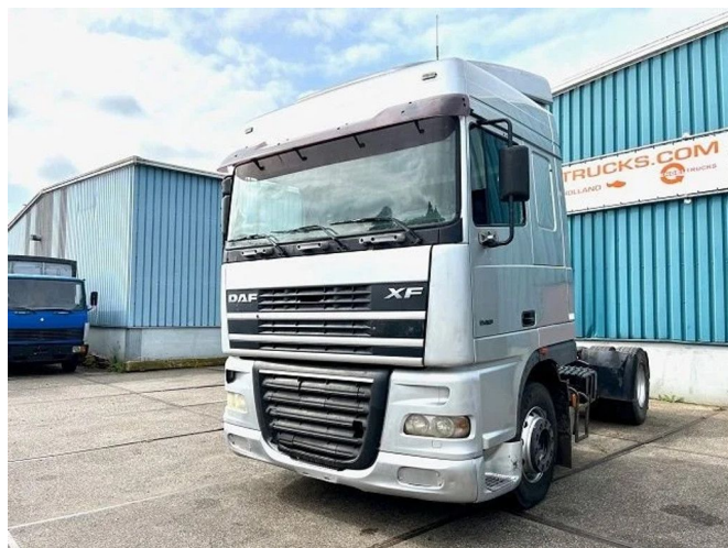
DAF XF 95.430 SPACECAB 4x2 TRACTOR UNIT (EURO 3 / ... Referenznummer: SN 55340919 Z