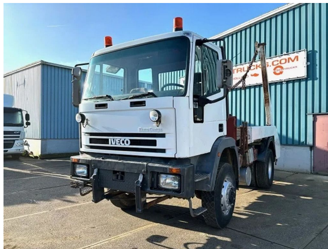
Iveco Eurocargo 135E23WR 4x4 FULL STEEL PORTAL CON...