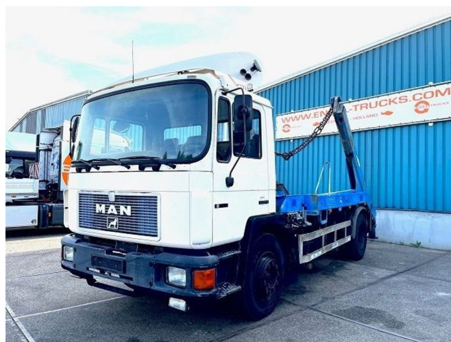
MAN 18 .232 (6 CILINDER) M90 WITH TELESCOPIC ... 4x2 Referenznummer: SN 55609062