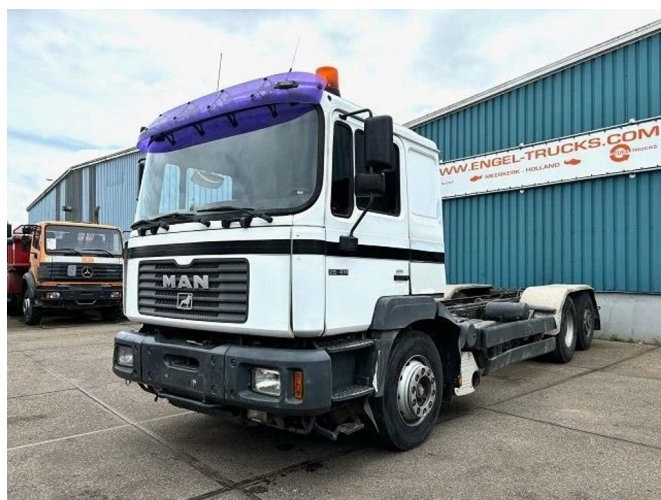
MAN 26.414 FNL-T (6-CILINDERHEADS) 6x4 CHASSIS (EU...