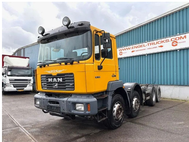
MAN 35.414 VF-TM 8x4 FULL STEEL CHASSIS (6-CILINDER...