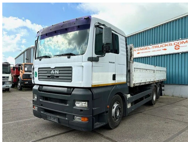
MAN TGA 26.410 XL 6x2 KIPPER (6-CILINDER HEADS) (ZF...