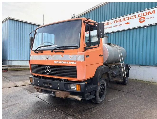
Mercedes-Benz 914 KO RHD 4x2 FULL STEEL TANK TRUCK...