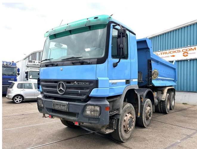
Mercedes-Benz Actros 4141 AK 8x8 MEILLER KIPPER ... 8x4 Referenznummer: SN 60404909