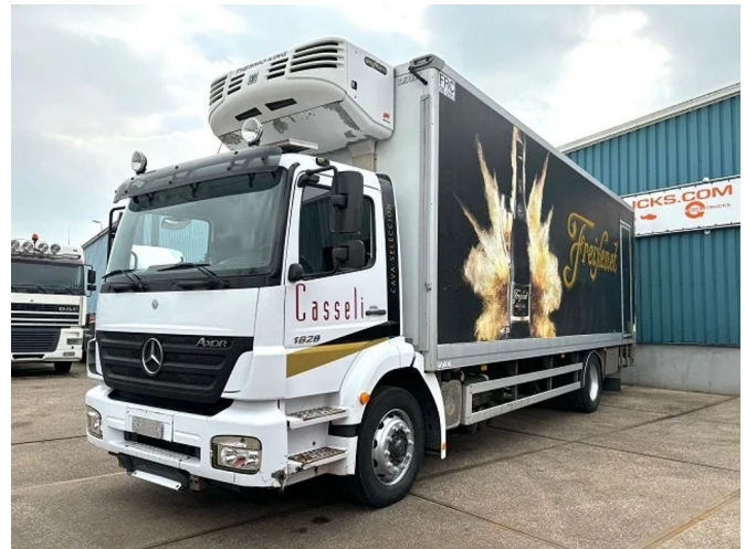
Mercedes-Benz Axor 1828 4x2 WITH THERMOKING SPECT...