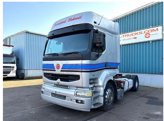
Renault Premium 400 .18T ROUTE 4x2 (POMPE MANUELLE...