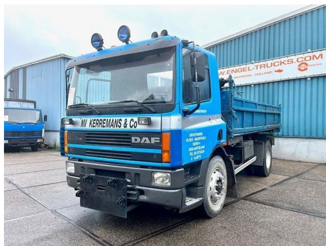
DAF 65.210 ATI 4x2 FULL STEEL KIPPER (EURO 2 / MANU...