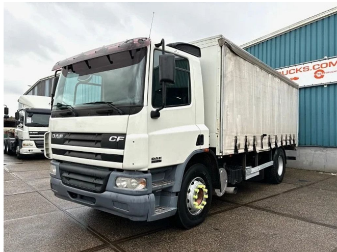
DAF 75 .310 4x2 WITH CURTAINSIDE BOX (EURO 3 / MAN...