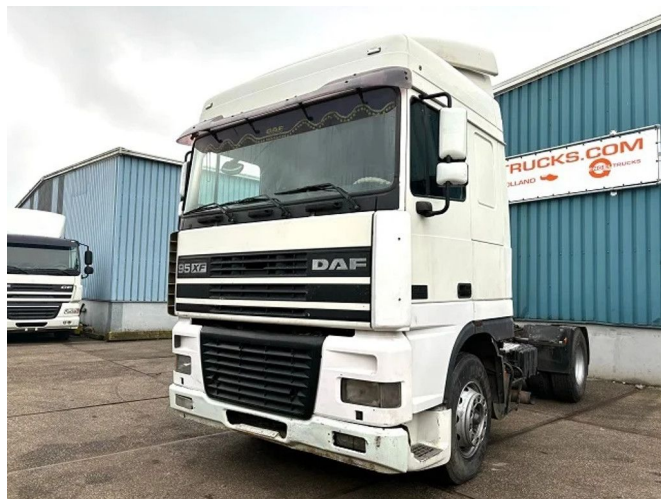
DAF 95.380 XF SPACECAB (EURO 2 (MECHANICAL ... 4x2 Referentienummer: SN 56068266 Z