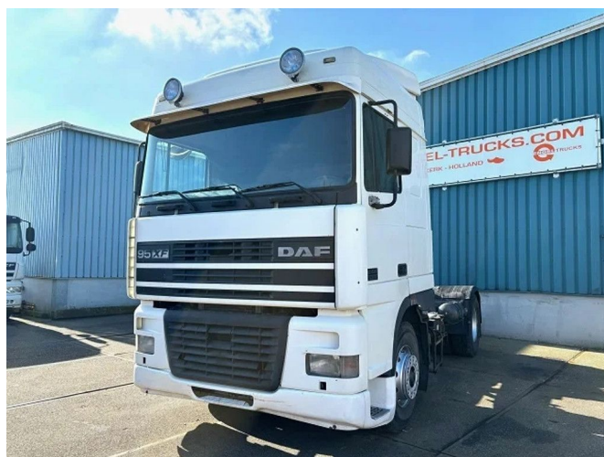
DAF 95.380 XF SPACECAB (EURO 2 / ZF16 MANUAL ... 4x2

• ABS • Aire acondicionado • Cabina de dormir • Freno de motor reforzado • Limitador de velocidad • Luces brillantes • Parasol • Spoiler para el techo • Tanque de combustible de aluminio