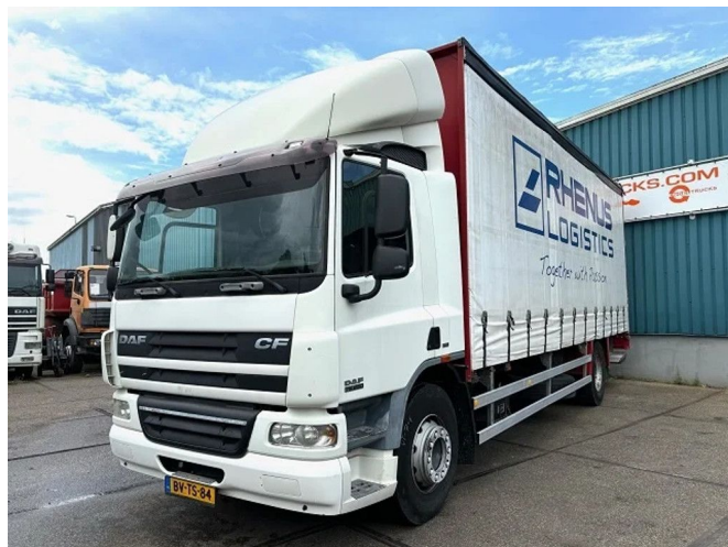
DAF CF 75 250 4x2 WITH CURTAINSIDE BOX, SLIDING R...