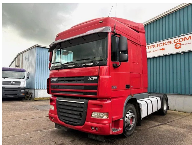
DAF XF 105.460 SPACECAB (ZF16 MANUAL GEARB... 4x2