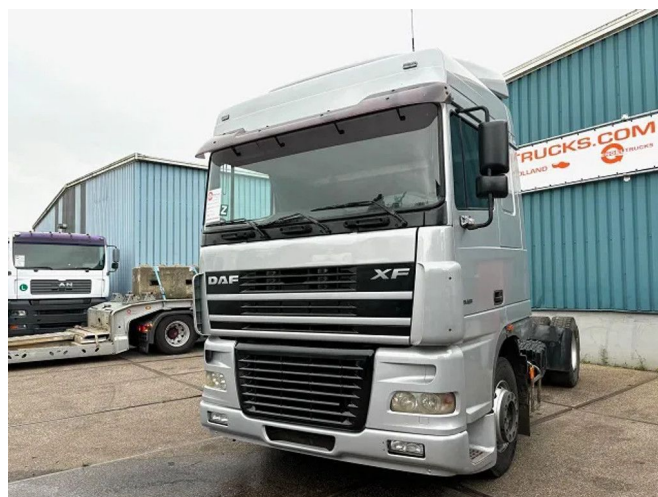
DAF XF 95.430 SPACECAB 4x2 (EURO 4 / ZF16 MANUAL ...