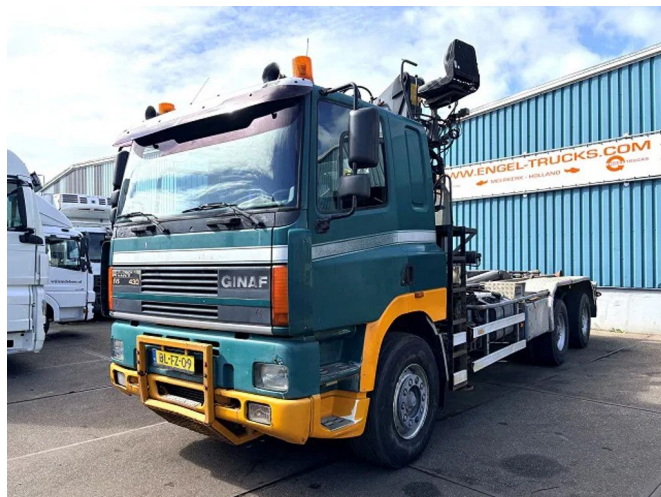
Ginaf M 3232 S 6X4 WITH LOGLIFT F105Z 27A & LEEBUR ...