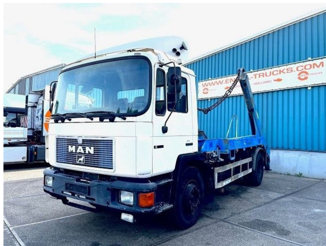
MAN 18 .232 (6 CILINDER) M90 WITH TELESCOPIC ... 4x2 Referentienummer: SN 55609062

• Caja de herramientas • Limitador de velocidad • Luces brillantes • PTO • Radio / reproductor de CD • Spoiler para el techo