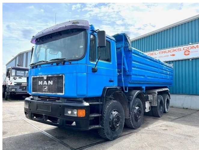
MAN 41.464 F2000 8X4 FULL STEEL KIPPER (EURO 2 / ZF... Referentienummer: SN 55149234 Z

• ABS • Limitador de velocidad • Parasol • PTO • Radio / reproductor de CD