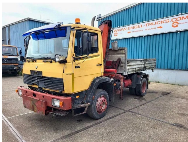
Mercedes-Benz 1117 K (6-CILINDER) KIPPER WITH F... 4x2 Referentienummer: SN 56826116