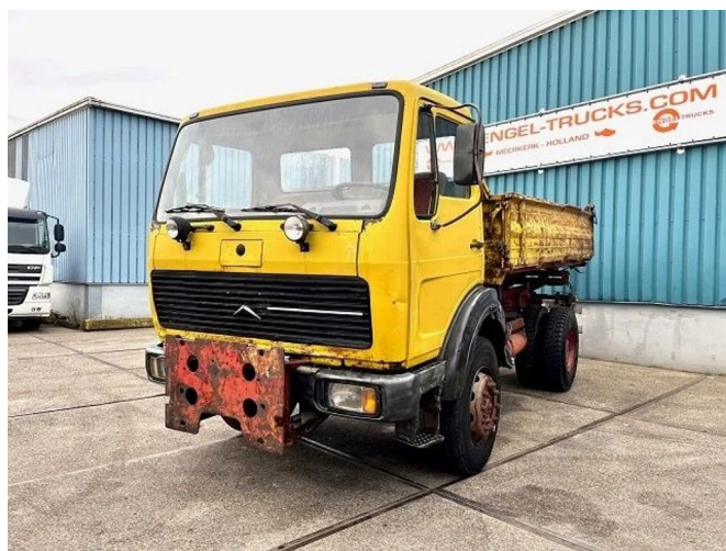
Mercedes-Benz 1617 AK 4x4 FULL STEEL 3-WAY MEILLER ...