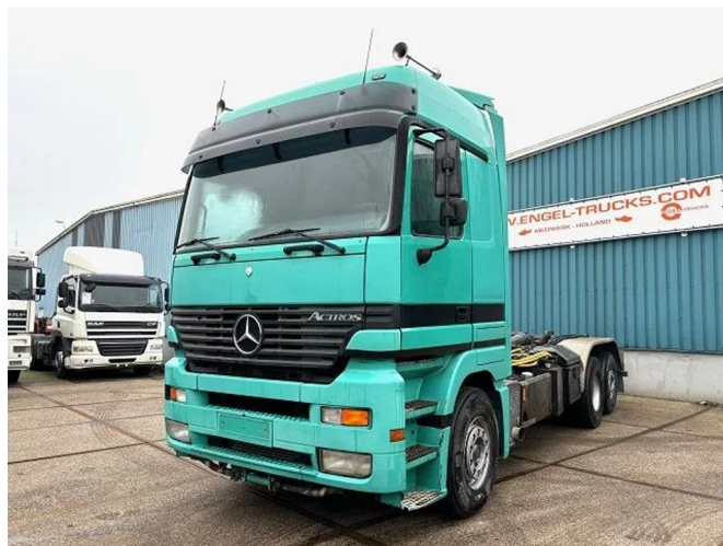
Mercedes-Benz Actros 2543 L MEGASPACE 6x2 MEILLER ...