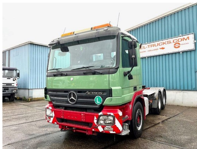
Mercedes-Benz Actros 2644 LS 6x4 (ORIGINAL 331.500 KM.)... Referentienummer: SN 54747680