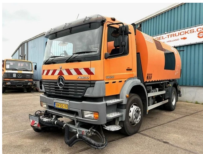
Mercedes-Benz Atego 1828 K RHD (ORIGINAL DUTCH... 4x2