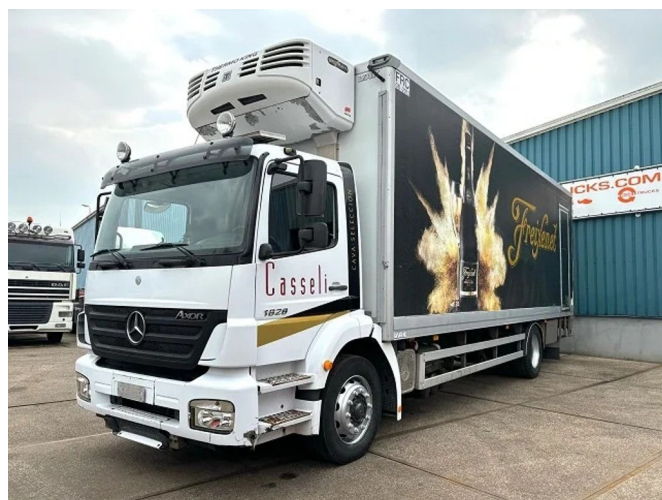
Mercedes-Benz Axor 1828 4x2 WITH THERMOKING SPECT...