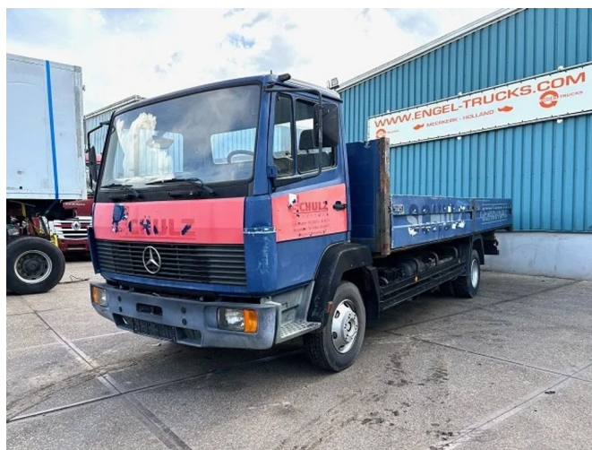
Mercedes-Benz LK 814 (6-CILINDER) FULL STEEL SU... 4x2