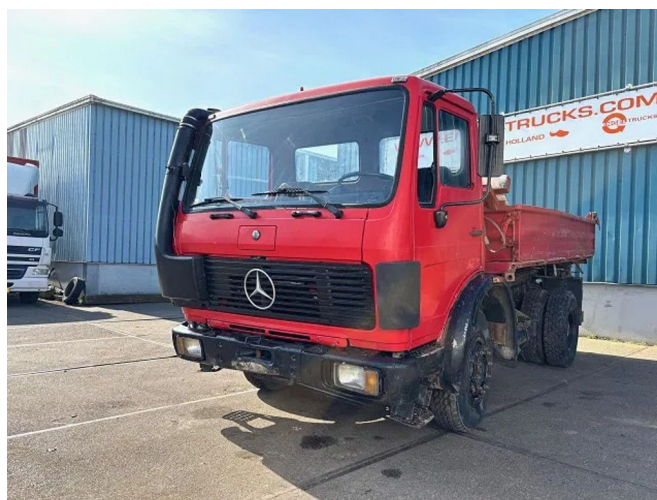
Mercedes-Benz SK 1414K 4x2 3-WAY MEILLER KIPPER (FU... Referentienummer: SN 56575945