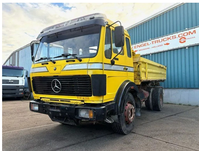
Mercedes-Benz SK 1935 V8 4x2 FULL STEEL 3-WAY MEILL...