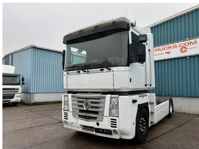
Renault Magnum 500 DXI PRIVILEGE (MANUAL GEA... 4x2