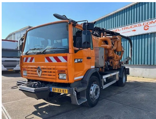
Renault Midliner 180 -15/D RHD WITH RAVO KZ7082/1... 4x2 Referentienummer: SN 58023559