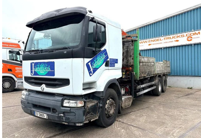
Renault Premium 385 .26G 6x2 PALFINGER / KIPPER (ME...