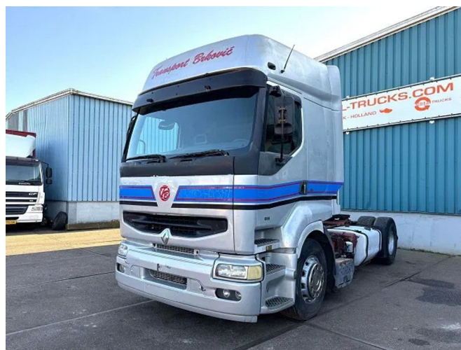
Renault Premium 400 .18T ROUTE 4x2 (POMPE MANUELLE...