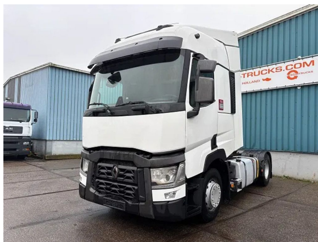
Renault T460 HIGH ROOF 4x2 (EURO 6 / AUTOMATIC GEA...