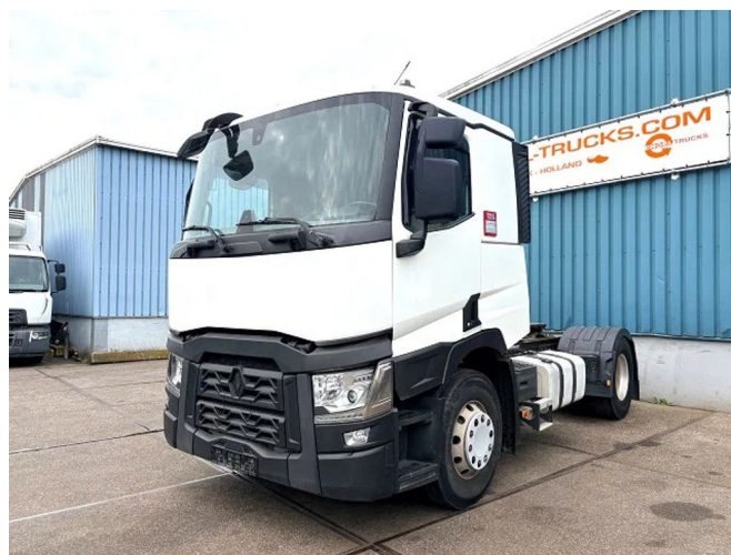
Renault T460 PROTECT SLEEPERCAB (EURO 6 / I-SH... 4x2