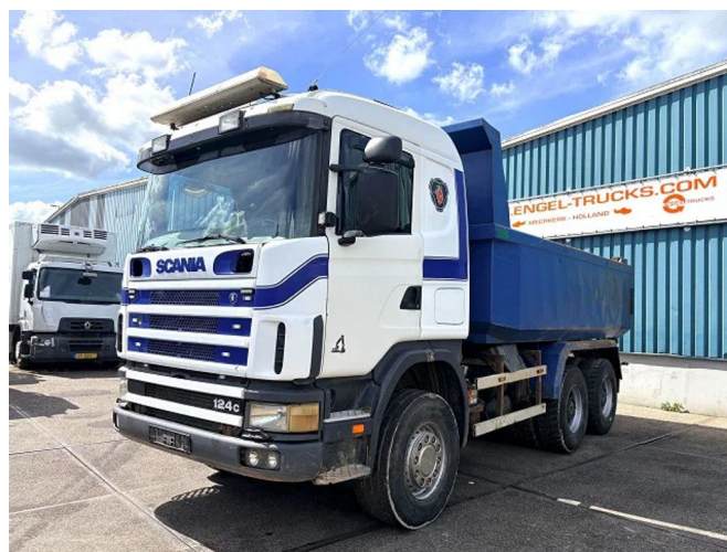
Scania R124-470 C 6x4 FULL STEEL KIPPER (MANUAL G... Referentienummer: SN 60375450