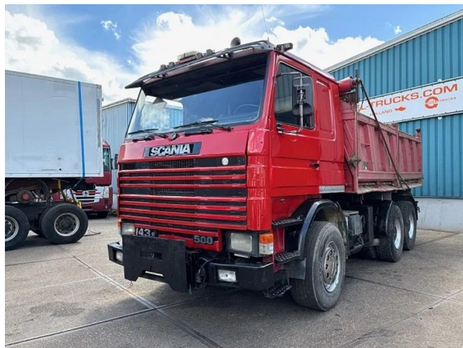
Scania R143-420 V8 6x4 FULL STEEL MEILLER KIPPER (M...