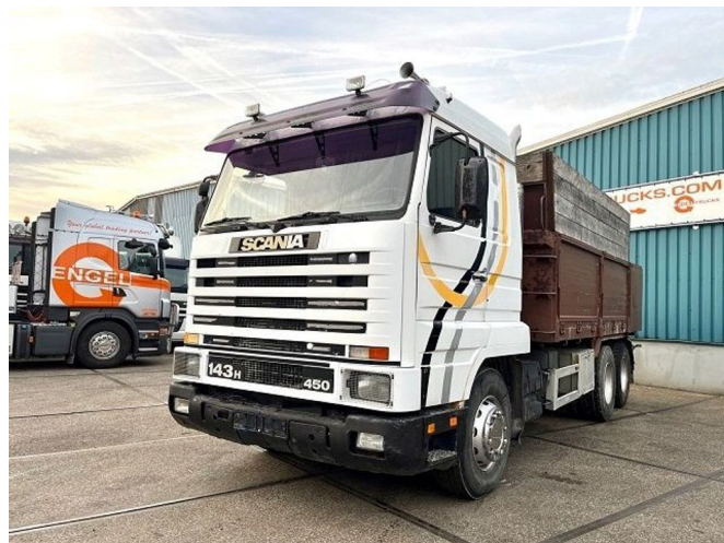
Scania R143-450 V8 STREAMLINE 6x2 FULL STEEL KIPPE... Referentienummer: SN 55639119