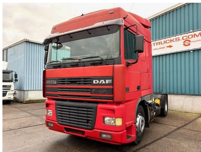
DAF 95.430 XF SPACECAB 4x2 (EURO 2 / ZF16 MANUAL ...