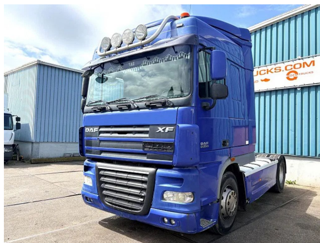
DAF XF 105.460 ATE SPACECAB 4x2 (EURO 5 / ZF12 MA... Referentienummer: SN 60419331